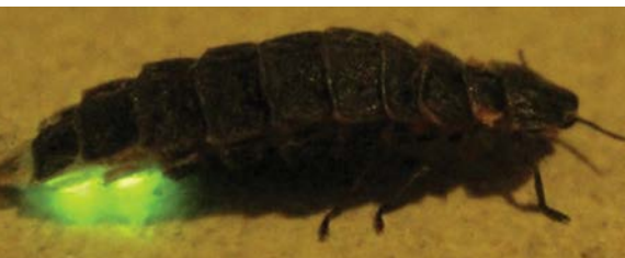
Ver luisant ( Lampiris noctiluca ) est perturbé par la lumière artificielle.

“ En cas d'éclairage permanent les plantes ne sont plus en mesure de se développer normalement. ”